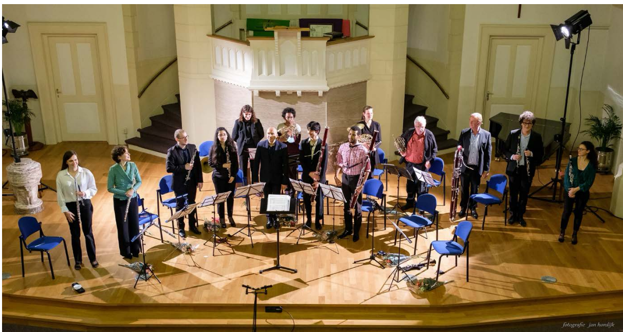
De 13 musici en de dirigent nemen het applaus in ontvangst in de Bergsingelkerk.