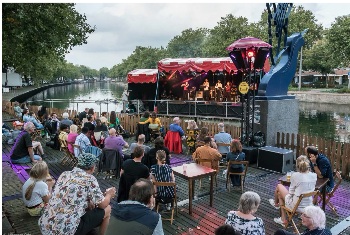
Het kwartet op de drijvende podium met publiek aan de kade tijdens het festival Muziek op de Rotte.

De samenwerking met het festival is heel soepel verlopen. Lettend op de Corona maatregelen, heeft het kwartet vanaf het drijvende podium op de Rotte twee uitvoeringen gegeven. Er waren die avond ruim 300 honderd bezoekers aanwezig.