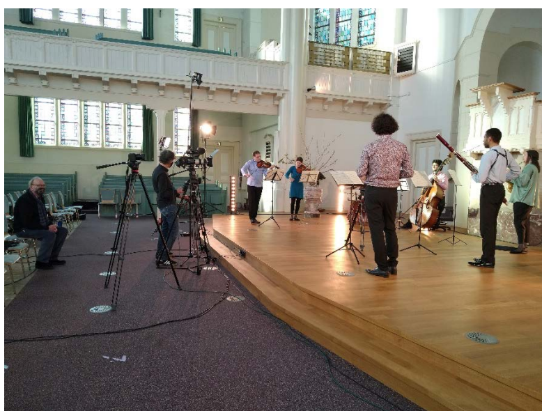
De musici en het team van Moois Media in de Bergsingelkerk tijdens de opnames.

Op 21 maart hebben we de gemonteerde video online gezet. Er waren toen ruim honderd kijkers tegelijk. Sindsdien hebben 1500 personen de video gekeken. De opbrengst van de streaming bedraagt €475,-.